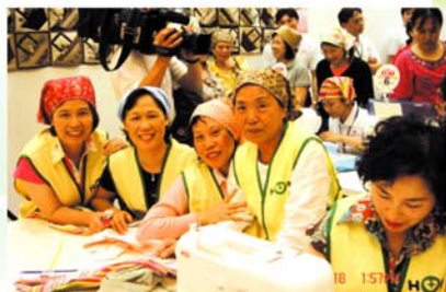
■協會志工媽媽也參與愛心頭巾競賽，不亦樂乎！