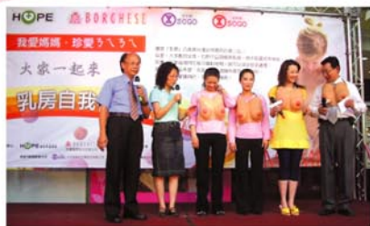
■高雄乳癌宣導活動台上下熱鬧一片

近期，全國貝佳斯百貨專櫃為響應關懷癌症病患，將設置零錢箱，民眾到貝佳斯專櫃選購美膚保養品時，也可以隨手捐贈發票及零錢，發揮小小心意，便可以一起幫助癌症家庭。