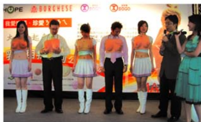
■台北宣導活動現場

今年母親節時，協會與貝佳斯、財團法人乳癌學術研究基金會及高雄市新興衛生所共同打造盛大的乳癌宣導活動，貝佳斯並提撥商品販售部分所得捐贈給協會，捐款十萬元。