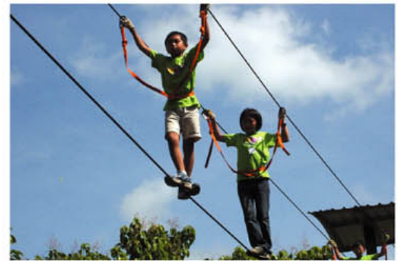
不畏懼高度兩樓半的小勇士

鼓舞人心！其他旁觀的孩子同樣值得鼓勵，雖然排的队伍很長，仍然沒有一個人催別人快一點放棄，只會直盯著奮戰的人，要他加油，有時還會給向右一點、向左一點的建議。