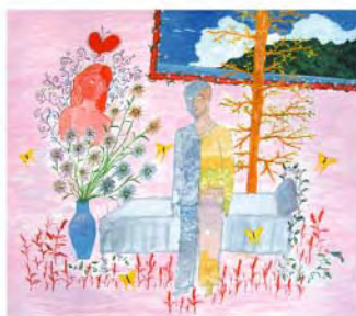
佳作/被愛的病人 英格 17歲 志工 關心體貼能讓病人在他的治療過程裡更舒適，心裡也不那麼。相對地身體的情況不會有所好轉，畫中的病友看到對親屬送的花，他所感受到的一切而轉變了。因為有愛，他的人生因此有了春天、有了色彩，故關心他的態度是很重要的。