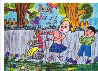
公園散步 顧明業 8歲 朋友生了嚴重的病，都沒辦法跟我們一起玩，那我可以帶他到公園，這樣一定可以有比較好的空氣、美麗的花及樹木。讓我的朋友心情比較好，忘記疼痛的煩惱，趕快生病好起來。