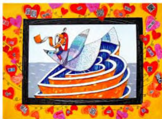
佳作/信念愛 葉慧君 40歲 生病絕大部分是由長期累積的壓力及負面情緒而來。所以正念及正覺思考是人要學來的，也是學生的功課。從照顧癌症病人身上，深深體會健康及念頭的重要。