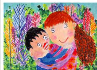
愛媽媽 徐瑋瑩 6歲 因為媽媽生病很多時間照顧我，所以我送去學畫畫，希望媽媽能康復陪我長大。