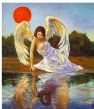
第三名/天使的羽翼 歐麗珠 52歲 志工 當了志工才發現自己和志工朋友們一樣充滿愛的能量，如隔天使般，溫柔地安撫著在病魔纏繞的病友，體貼地伴他們度過這特殊光的暫、怒、哀、樂。只要他們需要，我樂於親朋好友們。