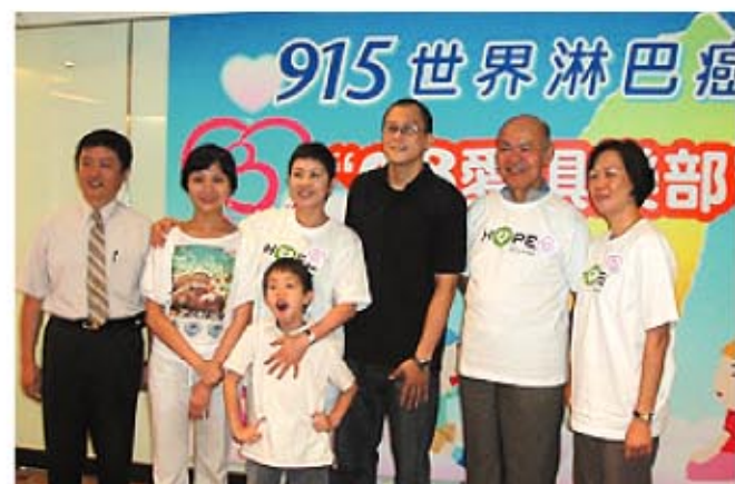
● 淋巴瘤友現身說法抗癌的經驗。

為此，癌症希望協會於2008年設置淋巴瘤宣導防治網站www.08i.org.tw，將淋巴瘤的主要症狀，利用生動活潑的圖像表現，並設計防治口訣：「燒腫癢汗咳瘦」，希望運用寓教於樂的衛教方式，提升台灣民眾對淋巴瘤的認知及自我守護的能力。透過上網響應活動的人數累積，一傳十、十傳百，將防治口訣：「燒腫癢汗咳瘦」推廣流傳，同時也透過宣導海報、宣導網站及活動，將淋巴瘤防治宣導活動推廣至全台灣各地，提醒社會大眾學習淋巴瘤的六大症狀，讓社會大眾對自身的淋巴組織健康更加重視與關心，好能早期發現、早期治療。