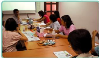
兒童遊戲治療家長座談會