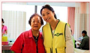
風書與正在化療的阿嬤粉絲開心合影。

投入公益不遺餘力的高盛證券，今年除了贊助協會「1001個希望」夏令營，更鼓勵員工們在閒暇之餘從事志工服務，幫助更多需要幫助的人。經得知協會在端午節前夕進行病房關懷，他們用實際的行動來表達對癌症家庭的關懷與支持。雖然他們無法親自將祝福送到病榻前的病友手中，但是這滿滿的愛透過端午香包粽，一定能傳遞到癌友的心裡。