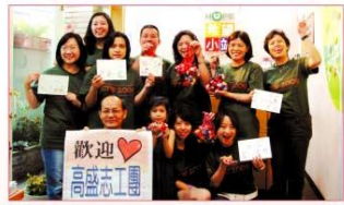
高盛志工團們拿著努力的成果，度過愉快的週末。

為給予癌症病友及家屬更多支持與關懷，癌症希望協會不定期組成志工關懷團隊，到病房給病友及家屬加油打氣。尤其每逢佳節團聚時刻，正與癌對抗的病友及家屬們，往往有更深刻的體會與感受。有感於此，癌症希望協會今年特別在端午節前夕，由協會的夥伴及志工們，一起將祝福與鼓勵，送給正在與癌對抗的病友及家屬，讓他們知道，抗癌路雖然辛苦，但是會有我們一路相伴！