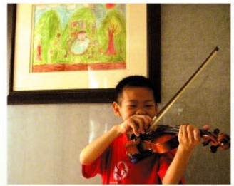
顯顯在自己的畫作前，現場表演他多項才藝之一的小提琴。

名左右，在媽媽的鼓勵下，他也培養了廣泛的興趣，包括太鼓、圍棋、小提琴。現在，不但泡溫泉這個願望已經達成，今年還開始接觸游泳，剛通過自由式200公尺測驗，老師已幫他報名參加宜蘭縣國民中小學游泳錦標賽。