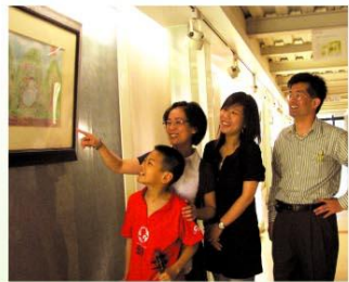
左起：顯顯與媽媽、癌症希望協會代表及台灣禮來股份有限公司駐台總經理，共同為「彩繪希望」羅東博愛醫院特展揭幕。

癌症希望協會與台灣禮來公司舉辦了2008「彩繪希望—揮灑生命畫筆的光與熱」繪畫比賽，期望藉由這些展現生命光彩的畫與話，融化更多悲傷、鼓舞更多的人。羅東博愛醫院因此特別選在溫馨五月，邀請彩繪希望得獎畫作做展覽外，