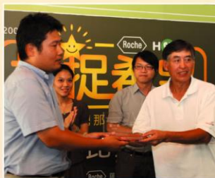
柯一正導演頒發醫療團隊組獎牌。