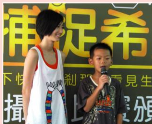
生命勇者顛顛，現場清唱《我希望》。