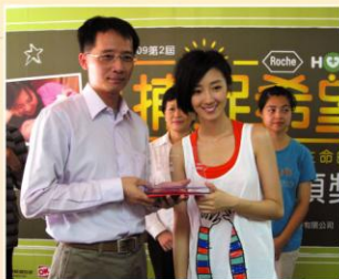
希望大使桂綸錕頒發癌症病友組獎牌。