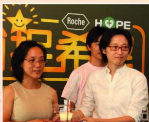
國評寶易林宇美副總領發癌友親友及社會大眾組獎牌。