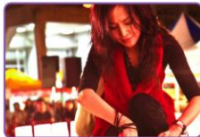
▲歌手楊培安才經歷過癌症家屬的憂與痛，他以一首《風中的羽翼》鼓舞癌症家庭要勇敢堅強，更以《感恩的心》向支持癌症家庭的所有朋友致意。