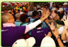
▲許多人依依不捨地不禁要問，明年會不會再見？我們說，或許形式會改變，但是一定會再見，因為愛與希望在抗癌路上是永不能缺席、堅持走下去的必須力量。