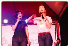
▲希望協會終身志工于台燈，《牽你的手》娓娓唱出「因為愛，伴你無怨無悔」的親友心聲。