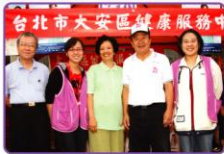
▲大安區健康中心主題宣導子宮頸癌免費篩檢，協助當天登記的民眾就近預約篩檢項目。