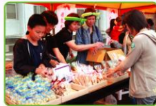
▲新秀麗理事幫忙義賣手工餅乾，搶購一空，她不忘替生命勇士照顧保留最後一份愛的禮物。