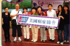
▲專程來支持建走的美國癌症協會隊伍。