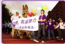
▲精神抖擻、笑顏開懷、隊呼不斷！大會旗首先開走機場，各隊隨後跟進，抗癌路上有你有我，期許一個無癌的未來！