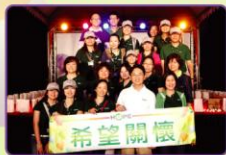
▲在堅定的情侶帶領下，所有的隊伍與工作人員一起走完最後一圈，為整個活動劃下感動的句點。