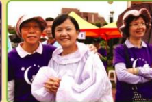
▲希望志工們好高興喔！沒雨了耶！