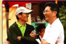
▲老天展歡顏，大家長也笑開懷啦。