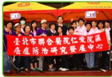
▲台北市立仁愛醫院呼籲五十歲以上的大眾，善用政府提供的免費篩檢機會，守護關道的健康。