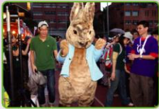
▲英國原裝、飄洋過海來RELAY的彼得兔，是大會的神祕嘉賓囉。向來熱心公益的彼得兔曾為癌症講故事書，今年要與抗癌勇士們攜手開步走！