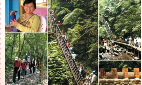
Ya! 我們征服了林美石磔步道「好漢梯」! 真不是蓋的!

由希望協會志工組組長慧慧姐籌備了很久的春季旅遊，4/22終於如願成行了。老天爺很幫忙，出發前，我們和煦的陽光！參加的團員，包括了希望協會的志工團隊、大腸癌俱樂部、淋巴癌俱樂部，一群人浩浩蕩蕩的從希望協會出發到宜蘭。