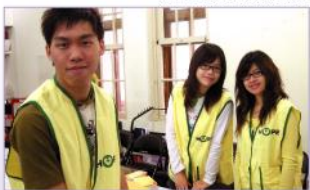
志工的體驗激起同學們對癌症病友服務的熱忱。

為了解社會支持系統對癌症病友的幫助及效益，從網路搜尋了很多癌症病友的支持團體，發現了網站架設齊全、布置可愛的希望協會。希望協會當初在沒有任何資助的情況下，走到今天如此成功的地步，想必一定有一群非常努力，又具非凡愛心的天使! 從協會的各種設置及為病友們設想的措施，更顯現了這一路走來的用心。