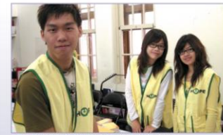
志工的體驗燃起同學們對癌症病友服務的熱忱。

為了解社會支持系統對癌症病友的幫助及效益，從網路搜尋了很多癌症病友的支持團體，發現了網站架設齊全、布置可愛的希望協會。希望協會當初在沒有任何資助的情況下，走到今天如此成功的地步，想必一定有一群非常努力，又具非凡愛心的天使！從協會的各種設置及為病友們設想的措施，更顯現了這一路走來的用心。