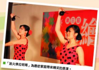
「迷火佛拉明哥」為癌症家庭帶來精彩的表演。