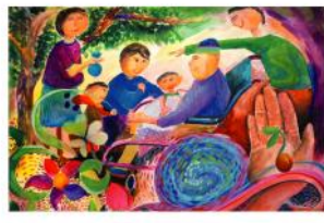
勸慰、加油! 佳作 陶聖賢 12歲

天上大鳥飛向神小鳥，象徵祈禱與神恩庇佑人，小鳥的祈禱與神恩庇佑小鳥，希望之樹飄到了他們的國家，變成紅通通老鷹一頭，好讓小鳥平安，不會在旦夕。