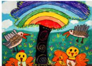
希望之樹 佳作 歐祈輝 8歲

天上大鳥飛向神小鳥，象徵祈禱與神恩庇佑人，小鳥的祈禱與神恩庇佑小鳥，希望之樹飄到了他們的國家，變成紅通通老鷹一頭，好讓小鳥平安，不會在旦夕。