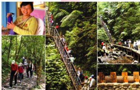
「Ya! 我們征服了林美石壁步道「好漢梯」! 真不是蓋的!

由希望協會志工組長慧慧姐籌備了很久的春季旅遊，4/22終於如願成行了。老天爺很幫忙，出發前，了我們和煦的陽光! 參加的團員，包括了希望協會的志工團隊、大腸癌俱樂部、淋巴愛俱樂部，一群人浩浩蕩蕩的從希望協會出發到宜蘭。