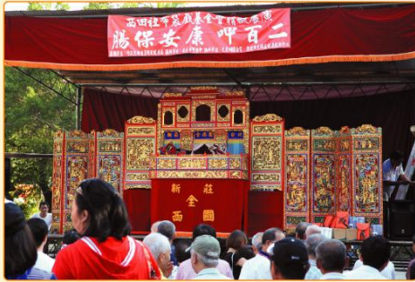
布袋戲催檢大腸癌，真是別開生面的宣導方式!

原本預定9月19日舉辦的布袋戲演出和篩檢活動，本期待有保生大帝加持護體，最終仍不敵凡那比颱風襲擊，只好延期到9月26日。非常感謝地主大龍峒保安宮慷慨再借場地與主辦單位國民健康局的體諒，更感謝西田社基金會與全西園學中劇團、大同區健康中心力挺承辦單位的我們，才能在短短一周內再次整備、宣傳與動員成功!