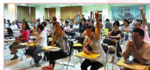
■打擊淋巴癌有哪些新武器？大家舉手熱情分享！

九月十五日是世界淋巴癌日。希望協會在每年的九月，都會舉辦淋巴癌學習營及相關的宣導活動，不僅讓正與淋巴癌抗戰的夥伴們更了解相關的治療與照顧訊息外，也希望透過宣導，讓大眾認識淋巴癌及隨時注意自己的健康狀況。