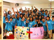
● 癌症家庭子女夏令營