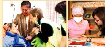
● 至癌症病房關懷病友