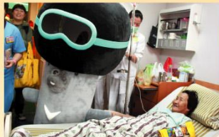
阿嬤開心地緊緊擁著台灣黑熊duma的手