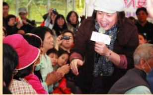
即便跳電卻絲毫不減康康與癌友的熱情互動

的王識賢、符瓊音外，今年更有民歌歌手曾淑勤、「小江蕙」之稱的曹雅雯、明日之星許富凱、金曲獎歌后曾心梅的加入，讓現場人氣滿滿、掌聲與感動不斷！