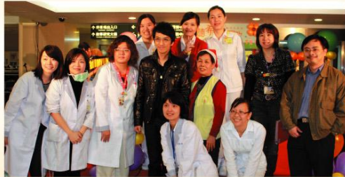
■ 基隆長庚情人湖院區音樂會幕後勞苦功高的醫療團隊