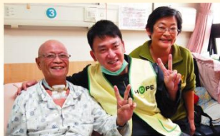
病友與家屬合照的同時還不忘問問夜人生的劇情發展