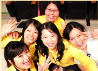
■ 活力十足的高醫癌症中心伙伴們