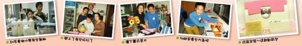
到店家做什麼有些無聊 加工了有空好玩了 瀟灑洗衣片 切肥皂要些力氣呢 成品包裝~這動動動

希望協會受到許多人的幫忙，而您又希望用哪種方式來幫助我們呢？希望協會永遠需要更多的人投入及贊助來幫助全台的癌症家庭。