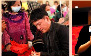
王識賢特別準備了專輯CD簽名在現場贈送給小粉絲