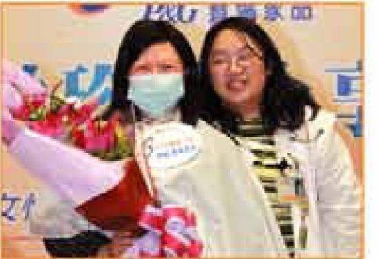
愛心無隔幫助癌友積極抗癌。罹患乳癌第2期的妻子媽媽（左1）開心地用自身經驗呼籲大家，早期發現、勇敢治療，就有希望！