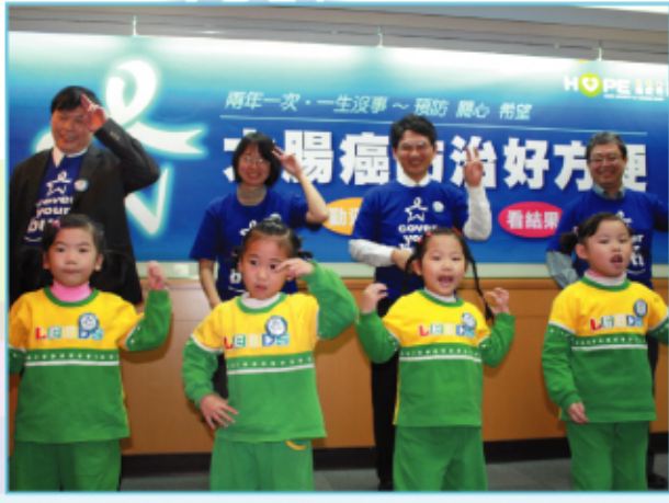
■與會來賓與小朋友們，穿著Blue Star 宣導T恤及配戴宣導胸針，一起用簡單的動作，請大家牢記~多蔬果、勤運動！

根據衛生署2007年癌症登記報告顯示，在台灣，平均50分鐘就有一個人罹患大腸癌，合併男女發生人數，大腸癌已成為癌症發生人數之冠。