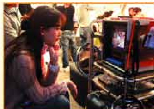
為宣傳6分鐘護一生，林志玲為婦癌宣傳首度執導，拍戲、剪輯一手包。