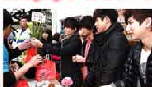
當天細雨綿綿，在愛心大使 Lollipop F 號召下，現場民眾熱情響應。

為照顧經商植而確診的乳癌、子宮頸癌、大腸癌與口腔癌之病友，協會今年特別邀請幾米授權畫作，並提供相關癌症疾病與照護資訊，製作溫馨與實用的關懷包，在第一時間提供癌友所需的資訊與服務管道，幫助他們緩解恐懼與不安，使其更有機會邁向康復！