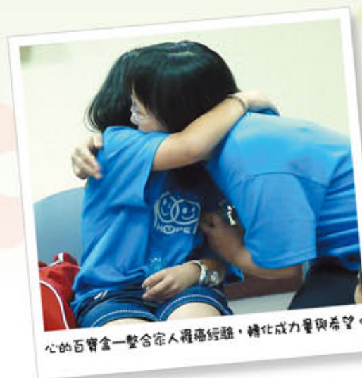
心的百寶盒—整合家人罹癌經驗，轉化成力量與希望。