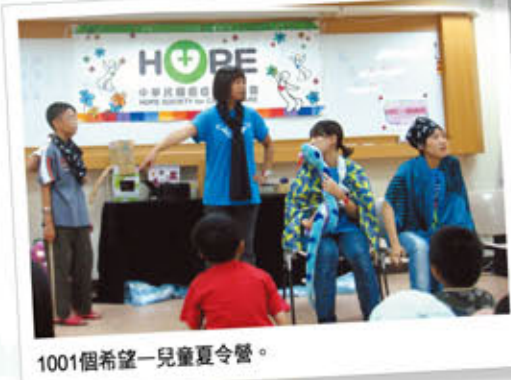
1001個希望—兒童夏令營。