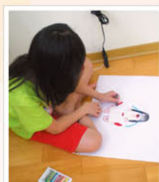
面對父母罹癌的心情。