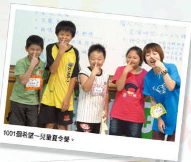
1001個希望—兒童夏令營。