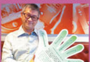
神經內分泌腫瘤資訊網榮譽站長星星王子