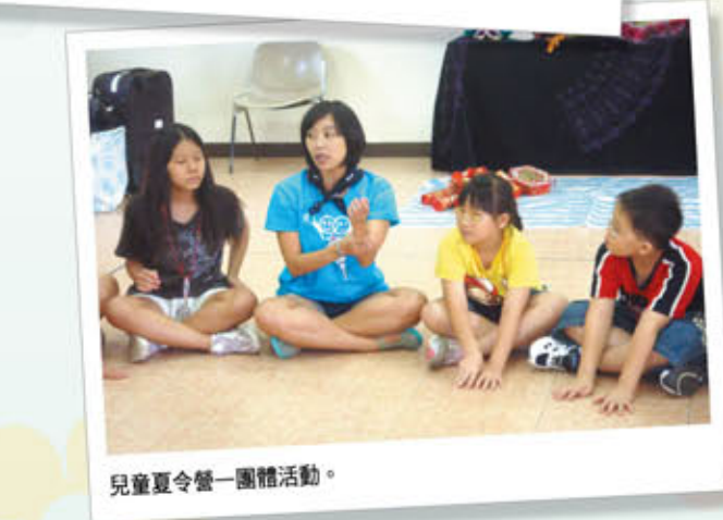
兒童夏令營—團體活動。