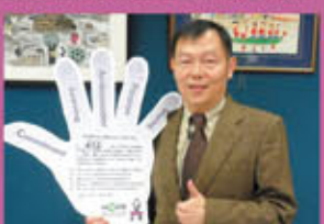
台北市政府衛生局林奇宏局長