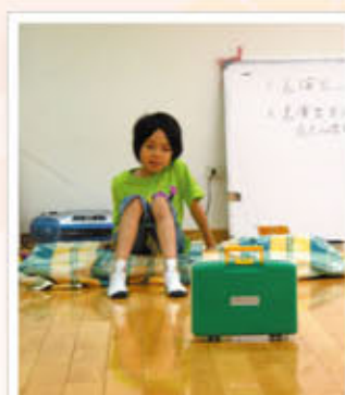
小劇場—父母罹癌時的那一天。