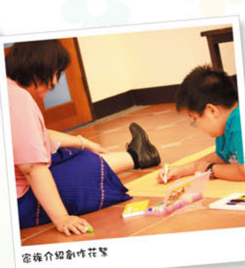
宗旌介紹創作花籃