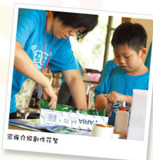
宗旌介紹創作花籃

阿宏老師說，其實爸爸和孩子都是為了對方好，爸爸希望孩子不要擔心太多事，爸爸會把事情都處理好，像大樹一樣，繼續讓孩子遮風避雨；但孩子也想多為爸媽做一些事，他們的行為，是出自對爸媽辛苦的疼惜。陪爸媽面對生命中的幽暗低潮，對所有人來說都不容易。阿宏老師和基金會希望幫助孩子，蛻變脫殼為美麗的蝴蝶，讓愛和希望，一直陪伴孩子。