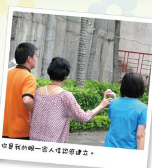
你是我的眼—家人信託感建立。