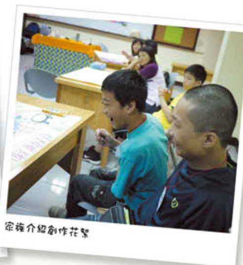
宗旌介紹創作花籃