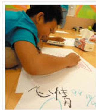
當我心情不好的時候。