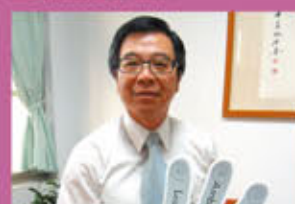
高雄市政府衛生局何啟功局長