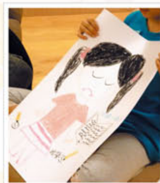
當我心情不好的時候。