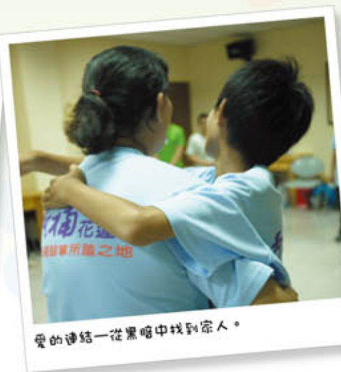
愛的連結—從黑暗中找到家人。