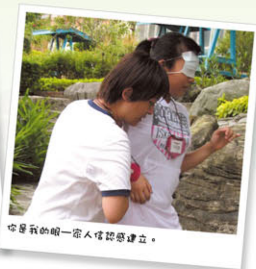
你是我的眼—家人信託感建立。