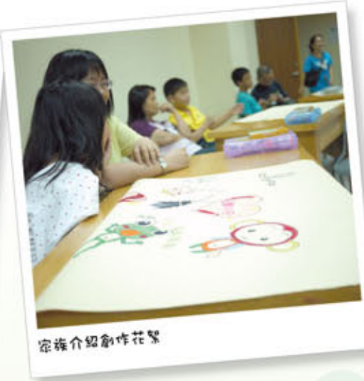
宗旌介紹創作花籃