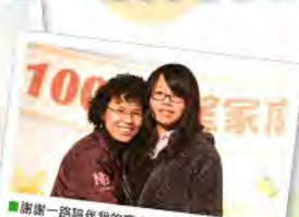
謝謝一路陪伴我的家人。