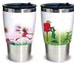
※幾米以實際產品為準