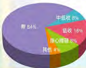
獎助學金申請家庭特殊經濟狀況分析

今年的罹癌家庭子女獎助學金已順利發送完畢，此次共有403人遞件申請（國中75人；高中133人；大專205人），其中，315人資格符合進入審核。此次申請者之父或母的癌症類別以乳癌、口腔癌及結直腸癌居多；癌症期別也以III及IV期居多；其中有近四成的家庭具有特殊經濟狀況（如低收入、中低收入……）。（詳見左圖）