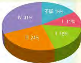
獎助學金申請者之(母)癌症期別分析