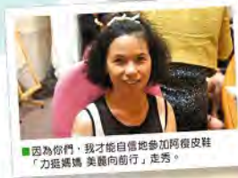
因為你們，我才能自信地參加阿霞皮鞋「力挺媽媽 美麗向前」走秀。