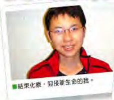
結束治療，迎接新生命的我。