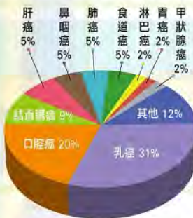
獎助學金申請者之(母)癌症類別分析