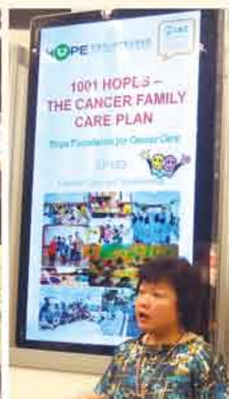
■ 1001個希望~罹癌家庭康復計畫

由國際抗癌聯盟 (Union for International Cancer Control, 簡稱 UICC) 每兩年舉辦一次的世界癌症大會 (World Cancer Congress), 今年在加拿大蒙特婁盛大舉行。本屆大會的主題是“連接世界影響力 (Connecting for Global Impact)”, 並把焦點放在如何將現有理論與知識運用到癌症的臨床實踐中, 使受到癌症影響的人們有所助益。有來自世界各地一百多的國家、上千位從事癌症相關的人員共襄盛舉, 一同為對抗癌症而努力。