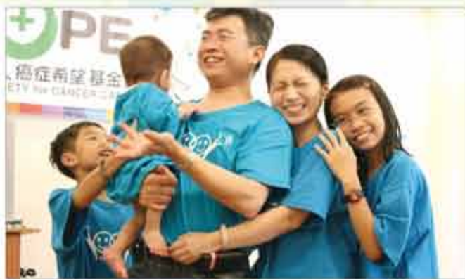
■家庭雕塑～癌症讓我們一家人緊緊依靠

改變，還有近一半的家庭覺得癌症讓家人的關係改變。凱芸老師運用「家庭雕塑」的活動，讓每個家庭呈現罹癌前後家人關係的改變。可能是來參與營隊的家庭本來就比較正向，我們發現大部份的家庭在罹癌前後有大改變的人大都是家中的爸爸。爸爸原來都為了家中經濟在外打拼，跟家人的關係相對都相對較疏離，但不管是配偶或是自己生病後，才警覺家人的重要性，而願意花更多的時間與家人相處。分享中，有不少的人都表示「愛要即時，不管時間有多久，家人的快樂才是最重要的」。