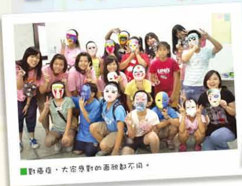
對癌症，大家應對的面貌都不同。