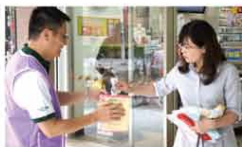
■站在便利商店門口邀請民眾捐出愛心