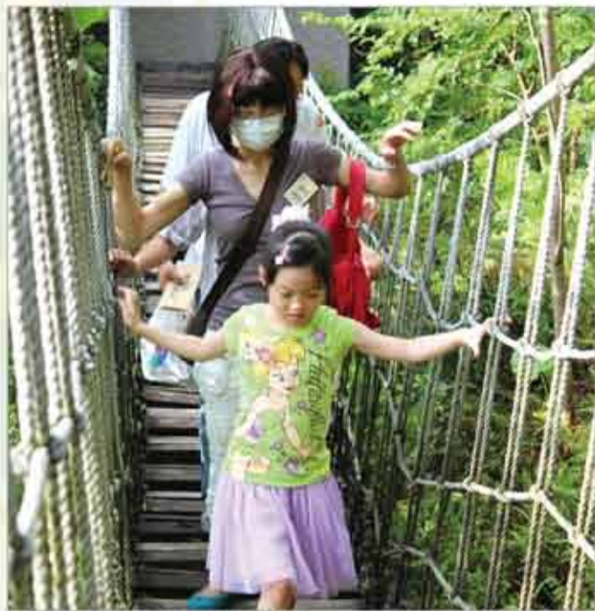
■和家人一起享受大自然的芬多精

因著「癌症影響的不只是病人，而是所有的家人」這樣的想法，癌症希望基金會每年暑假前後都會辦理罹癌家庭親子營，希望讓家人可以有機會一同歡笑與擁抱，也可以與其他罹癌家庭分享與交流。今年，北區在充滿芬多精的三峽大板根森林溫泉渡假村辦理，南區則是選在環境清幽的美濃一本書道院，共有21個家庭，64人參加，屬歷年來最多人的一次。