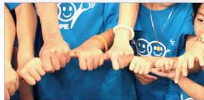
■大手小手牽在一起

其中，有幾個是單親家庭，因為沒有另一半的支持，罹癌的媽媽都顯得更堅強，卻也都害怕不能陪伴小孩長大。但有人分享，藉由這樣的機會讓小孩要學習獨立，也讓自己不要把所有的責任都攬在自己身上，小孩其實也有自己的能力的。