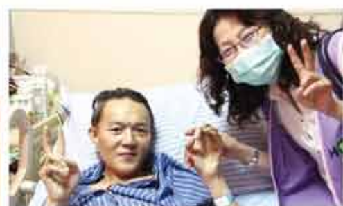
■手作的關懷禮送到病房給病友鼓勵與加油