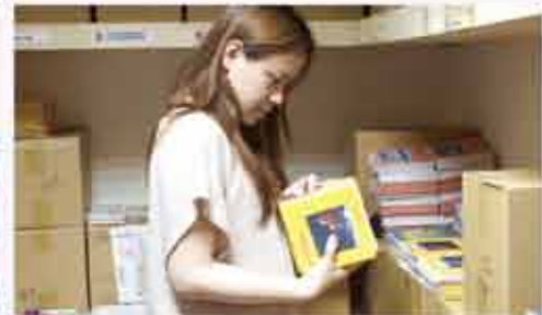
■協助衛教手冊寄送