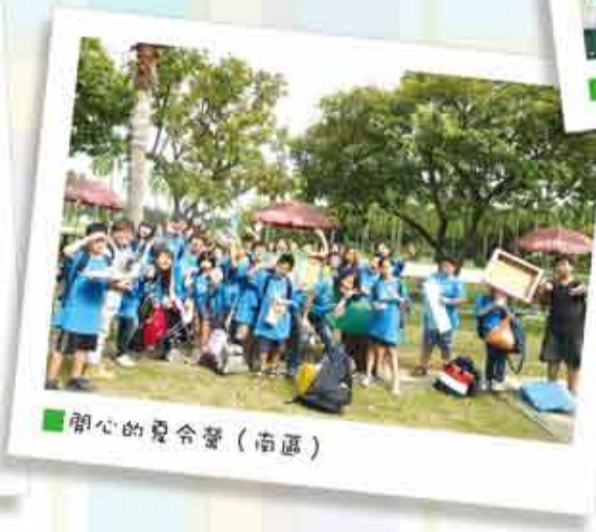
開心的夏令營(南區)