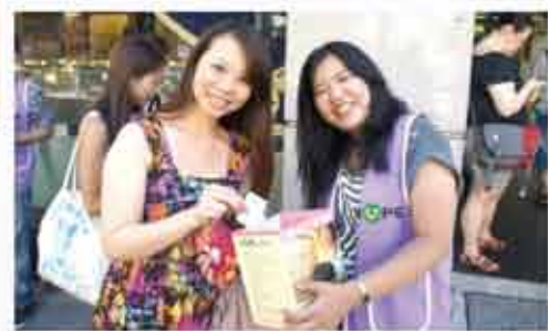
■走上街頭募集假髮製作經費