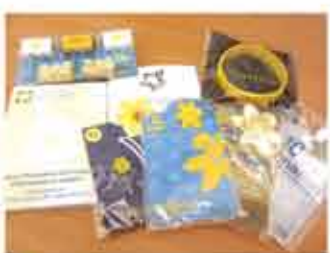
■ 抗癌胸罩與相關產品