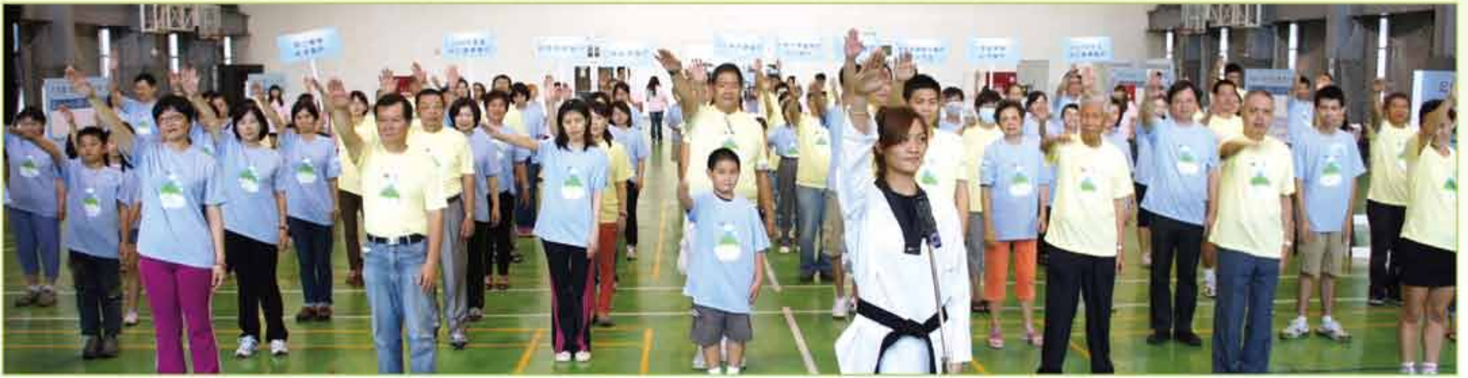
由奧運銅牌跆拳道國手曾櫟聘帶領淋巴瘤病友、病友家屬及醫療人員進行運動員宣示。

915為世界淋巴瘤日在台第九週年，為了呼應病友們與奧運選手一樣堅持不放棄、贏得勝利的毅力與精神，今年舉辦「打擊淋巴瘤、趣味奧運會」活動，特邀奧運銅牌跆拳道國手曾櫟聘與來自全台各地的上百位病友、家屬、醫療人員共襄盛舉。