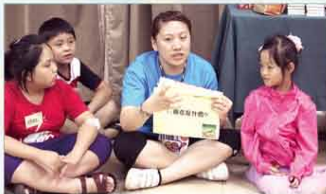
■護理師教小朋友認識癌症

面對癌症，每個家庭有不一樣的故事與變化，營隊前我們做了罹癌認知問卷調查，結果顯示八成以上的家庭醫療的費用增加，甚至有四成以上的家庭有明顯的經濟