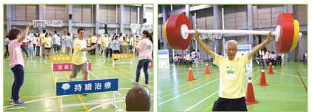
大家都使勁地全力衝刺

癌症的造成是複雜的且源自於長久深遠的生活習性，一旦顯示在身體上的最終結果時，無論是誰都會感到驚恐，尤其在乳癌的治療過程中，除了要面對未來不確定感與死亡的焦慮外，同時可能得面對因治療失去乳房而改變身體意識的失落，形成一種在病情世界中無聲無助的哀慟。因此，從混亂、困惑為何會罹患此疾病，到治療時的害怕與生活中的種種困擾；有時那份難以言語的孤單、無助感，會讓人對自我產生懷疑和對生命感到無望，也可能反應在個人、家庭、工作和人際等，甚至出現焦慮、憂鬱和