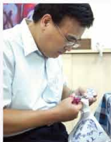
■參與蘇谷巴特製作義賣品