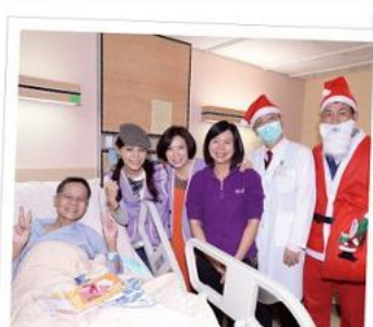
■ 音樂會期間適逢聖誕節，院方人員也精心打扮同歡。