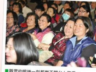
■觀眾的眼神一刻都離不開台上歌手。