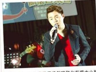
■百萬王子~許富凱深情獻唱融化在場大小粉絲。