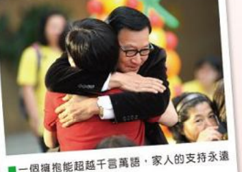
■一個擁抱能超越千言萬語，家人的支持永遠是病友最有力的後盾。