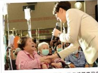
■看到笑得合不攏嘴的阿嬤，林志炫董事又安可了三首歌。