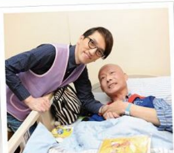
■ 病友看到林志炫董事顯得非常興奮，顧不得身體不適堅持起身合照。