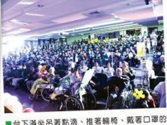
■台下滿坐吊著點滴、推著輪椅、戴著口罩的聽眾，是許多歌手不曾有的演出經驗。