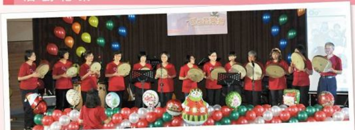
■ 由病友及家屬組成的手鼓班，以「我希望」一曲揭開音樂會序幕。