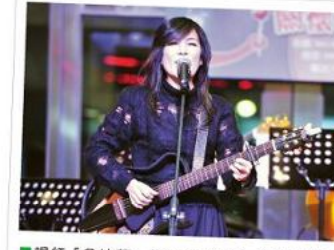
■唱紅「魯冰花」的曾淑勤帶來一連串組曲溫暖人心。