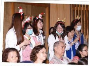
■音樂會不只为癌友而唱，辛苦的護理人員也是我們想慰勞的對象。