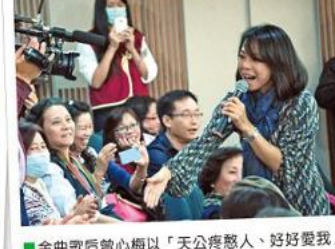
■金曲歌后曾心梅以「天公疼憨人、好好愛我」將氣氛帶到最高潮。