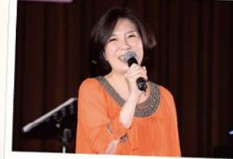
■林育蓉董事以主持人身分響應活動至今已主持了12個場次囉！