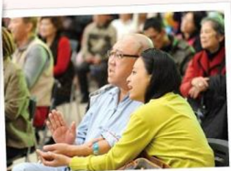
■聽到忘情處，忍不住牽起彼此的手打拍子哼唱。