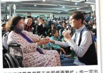
■林志炫董事演藝工作即便再繁忙，也一定出席獻唱為病友打氣。