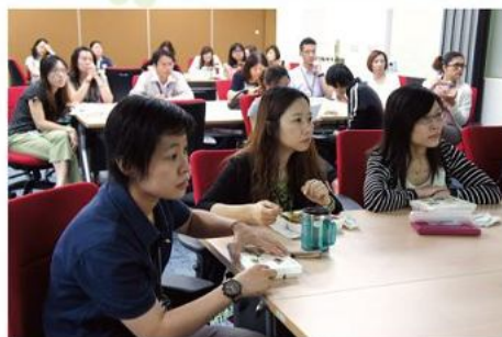
專心投入在防癌知識學習中，連午餐都暫時放下了。

康健人壽3年多來持續運用企業的力量支持癌症希望基金會服務資金，並號召企業員工擔任志工及響應捐款，透過各種方式宣示與癌症希望基金會一同重視防癌議題的熱情。而長期關懷罹癌家庭的康健人壽，更關心內部員工的健康，因此邀請癌症希望基金會護理師至各辦公室向同仁們分享防癌知識，並藉由與護理師的互動問答，建立起正確觀念及解