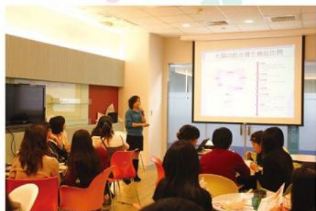
透過講師分享了解各種癌症預防及治療的方式。