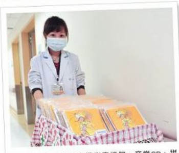
■ 社會各界所贊助之幾米春捲包、音樂CD、拼布柿子包，都會在音樂會開始前由病房關懷大使親手交予病友，傳遞祝福。