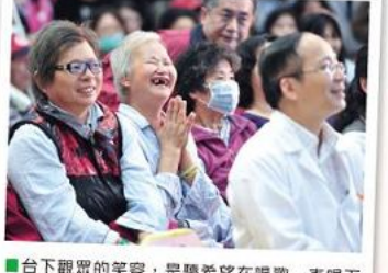
■台下觀眾的笑容，是聽希望能在唱歌一直唱下去的動力。