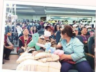
■歡樂的歌聲激起老爺爺的童心，搶著向工作人員要氣球拿回病房。