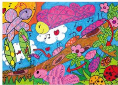
佳作 黃珮薰 10歲 飛向希望 不要以為自己是個弱小的人，小小的毛毛蟲在一次又一次的蛻變和經歷，面對成長中許多的困難，都能勇敢面對，最後變成一隻美麗的蝴蝶，飛向充滿希望和夢想的天空。