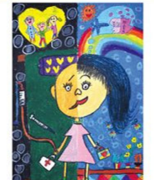
佳作 張郡恩 8歲 幸福一直都在 阿嬤生病已經有一段時間，雖然生病讓她十分不舒服又痛苦，可是只要她一想到家人每天陪伴她，她就更有勇氣，因為她相信幸福就在眼前，所以她仍然每天都保持笑容，讓我覺得好感動。