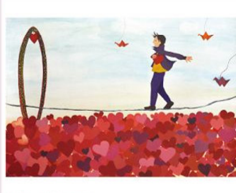
佳作 芯芯 23歲 讓愛為你加油

光線是照亮世界的源頭，它可溫暖人心，因奶奶突然的離世，讓我想用點描的方式表達漸漸消逝的感覺，兩手捧著的是溫暖大家的火光，這是奶奶讓我知道的道理，所以我想把這道理畫出來，與世分享。