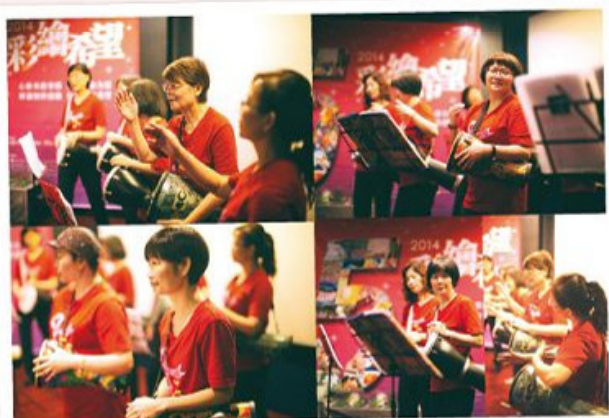
■ 希望手鼓樂團帶來「盾杯希望之曲」為典禮揭開感動序幕。

5月10日下午2點，在誠品敦南視聽室的典禮上，1~5屆近百位的得獎者與親友家屬親臨現場，在母親節前夕一同分享得獎喜悅，一同感受生命旅程，一同見證、肯定彼此的榮耀。抗癌的路上或許崎嶇難行，但我們一同互伴走過人生風雨。