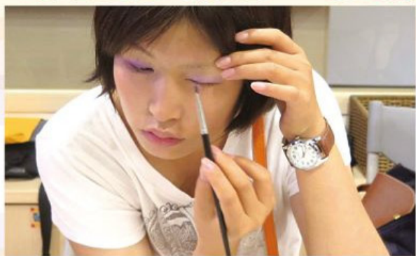
■就算生病也要美美的！

一次，一位82歲的病友阿嬤來租借假髮，試戴了幾頂假髮，當阿嬤試戴好滿意的假髮時，阿嬤嘴角緩緩上揚，露出了像小女孩般的笑容，她告訴我，自從化療掉頭髮以後，已經好幾天都失眠了，當時的我真的好驚訝也好開心。驚訝的是，連阿嬤已經八十幾歲的年紀，那個我們以為應該非常豁達的年紀，原來也還是那麼在意外表的改變～開心的是，