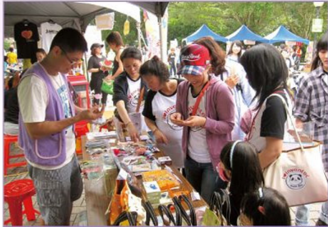
■英業達家庭日義賣活動。