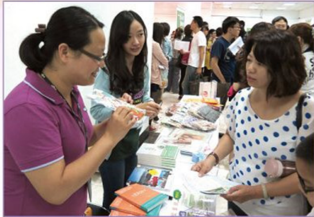
■富邦人壽在地生活圈樂活人生系列講座外場義賣活動。

一位濃濃台灣國語腔的阿嬤帶著兩個小孫子來到基金會的義賣攤位前，臉上洋溢著陽光般的笑容，沒有人看的出來，這位阿嬤曾是大腸癌三期的病友。阿嬤跟小孫子說：「一個人可以挑一樣東西，這可