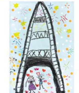
佳作 陳禹彤 6歲 爬上去，就會看見希望 阿嬤說：不論遇到什麼都要勇敢走過去。開刀很痛、打針好難過，但阿嬤很勇敢，現在才能抱抱親親妳！我畫了一座高塔，前面黑黑的有東西擋住，但只要爬上去就可以看見煙火，我要阿嬤努力向上爬，就會看見健康和希望了。