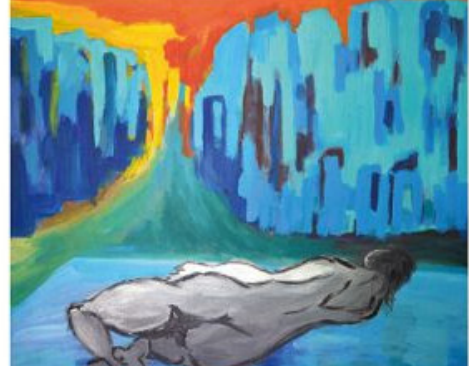
佳作 陳靜玉 43歲 燃燒

對癌末病人來說，身心靈同等需要好好地被照顧，就算長夜漫漫，路途遙遠，星星和月亮依舊默默地散發著愛與溫暖，為我們指引著方向。除了醫療，我們更希望能陪伴病人找到生命的意義，有勇氣來經歷這段英雄之旅。