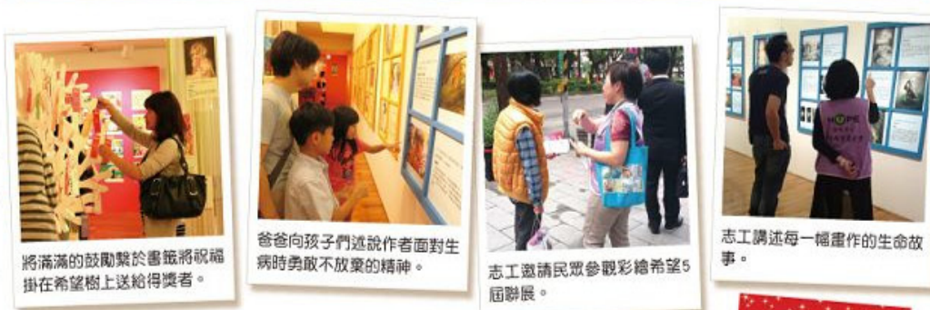
將滿滿的鼓勵繫於畫框將祝福掛在希望樹上送給得獎者。

感謝活動期間各地網友、癌友、志工以及康健人壽同仁、國立臺北護理健康大學健四一同學們的支援，感謝你們的熱情參與，得以讓聯展人潮不斷，感動無限。