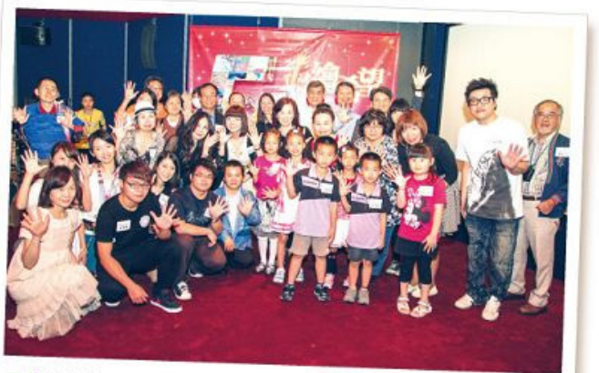
■ 彩繪希望5屆來的得獎老友及新朋友共同熱情參與頒獎典禮，期望藉由自己的生命故事散播更多鼓舞與溫暖。

為慶祝近9年來各界對【彩繪希望】的支持，除今年5月10日在誠品敦南B2視聽室舉行「頒獎典禮暨5屆聯展開幕式」外，特別籌畫5月10日至5月18日於誠品敦南B2藝文空間舉辦一連9天的「五屆聯展」，邀請1至4屆得獎者一同回娘家。為此活動，身為評審老師的于台煙及簡福錚老師還特別提供畫作共同展出。