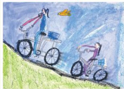
佳作 汪庭宇 7歲 心愛的腳踏車 希望有一天能和媽媽一起騎腳踏車出去玩。