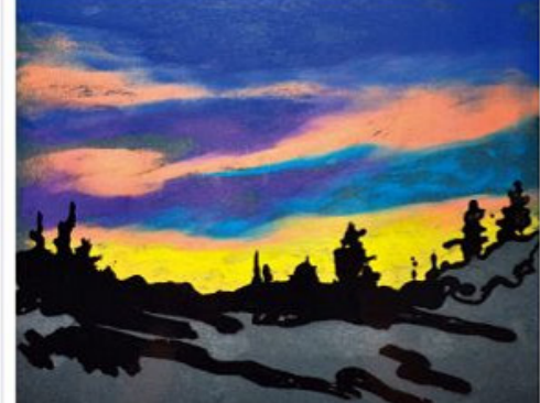
佳作 陳松江 75歲 福壽山夕照

生命不在乎長短，只在乎是否認真走一回。曾經陪伴一位洗腎多年合併膀胱癌的患者，發現罹癌已末期醫生預估只剩半年，罹癌初期他選擇消極與放棄；他說：不想孤獨一個人陪伴是最大的幸福。他帶著我的祝福，安祥的離開。