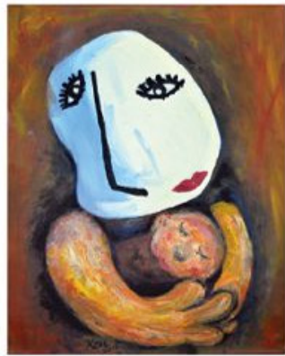
第二名 KSU 33歲 希望的誕生

大自然賦予這世界無窮生命力，不管風吹雨打日曬雨淋，花兒依然盛開，魚兒仍然力爭上游，鳥兒高歌歡唱。我們一起無畏懼的向前！