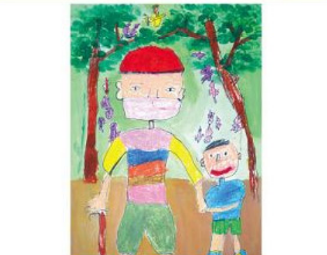
佳作 嚴元 6歲 戴口罩的阿公 我的阿公是假面超人，會戴著口罩拿著拐杖陪我散步，我會扶著阿公；阿公笑著說：「我是老面超人，會永遠保護你」。