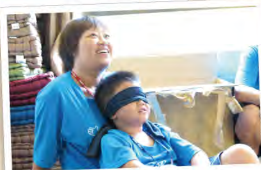
■全心感受媽媽的心跳