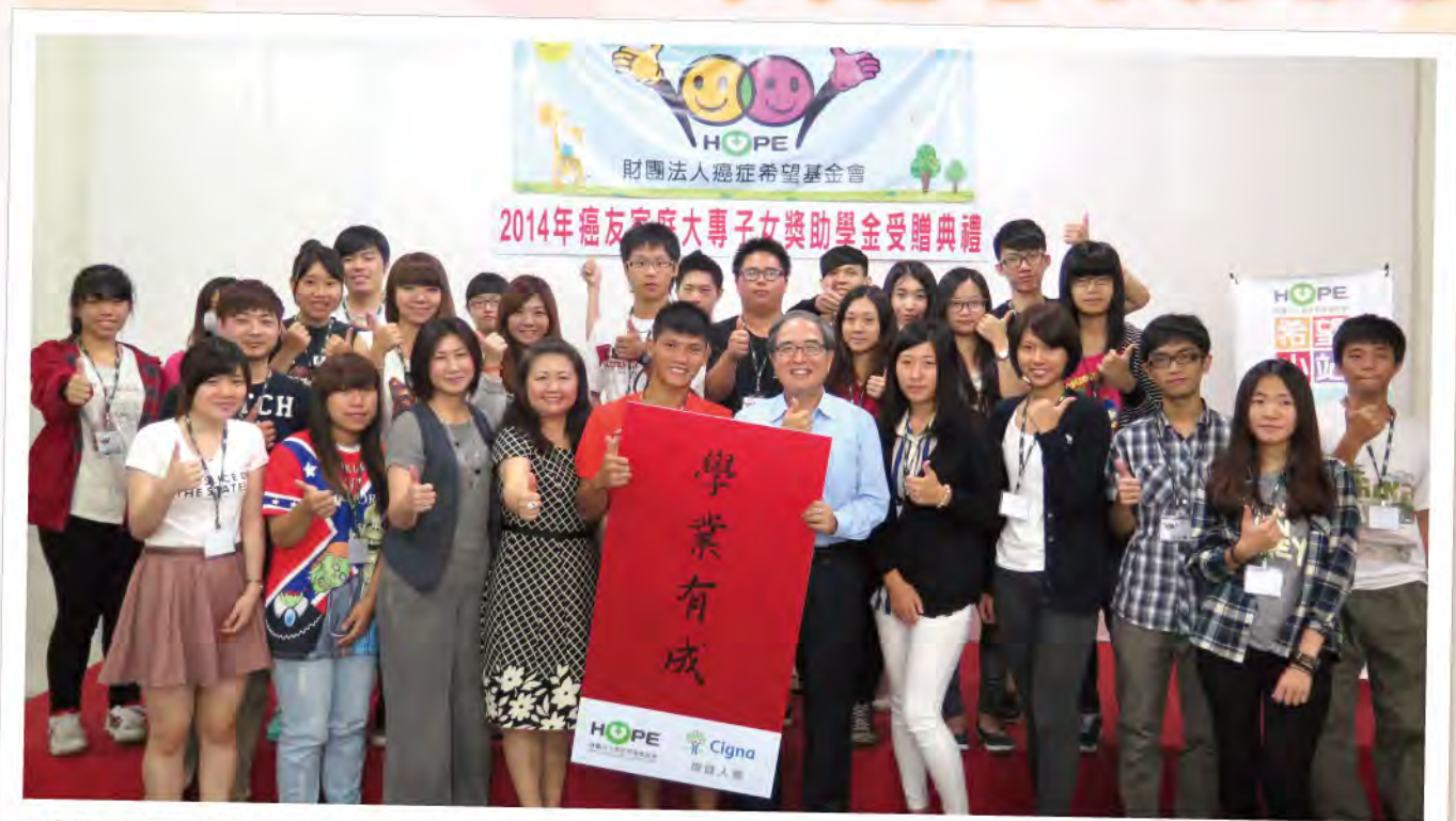
康健人壽祝福每位獲得獎助學金的學生學業有成。