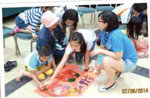
■一起創造幸福的家