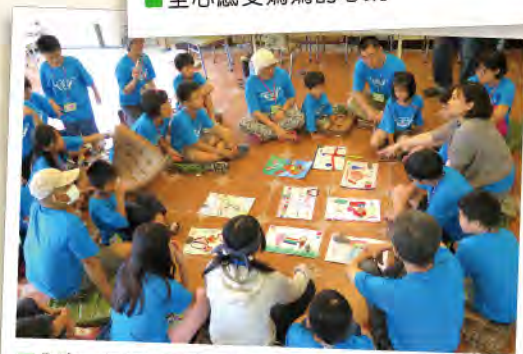
■全家一起想看看癌症小石頭該擺在那裡呢？

任務存在。第二天進行「癌在家中的位置」活動時，有位小朋友在遊戲規則說明前得意洋洋地拿了一個大大的石頭，一聽到手中的石頭將象徵「癌」，馬上換成小小的石頭，其驚慌的模樣，讓我們知道，小朋友們其實知道爸爸媽媽不舒服的原因在哪！