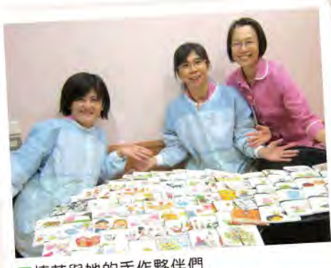
■ 捷芸與她的手作夥伴們