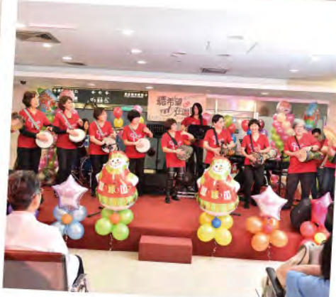
■ 癌症希望基金會的康復病友組成「希望手鼓樂團」為「希望在這裡」關懷音樂會開場。