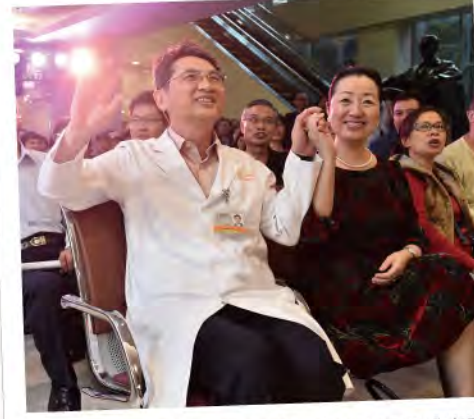
■ 雖然治療的路途充滿挑戰，但只要互相「牽阮的手」，一同陪伴不驚艱苦。