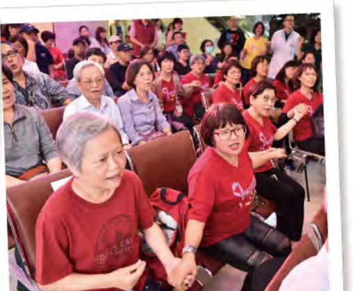
■ 癌友家庭牽起彼此的手，在癌症希望基金會「聽希望在這裡」關懷音樂會傳遞溫暖與希望。