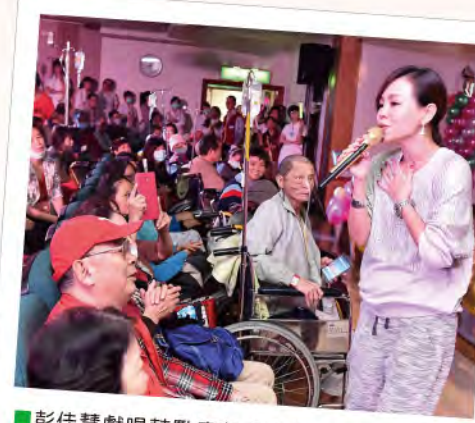
■ 彭佳慧獻唱鼓勵癌友「人生難免都會遇到疾病，但疾病是鍛鍊我們可以擁有更堅強的意志。」給了癌友及家屬正面的力量！