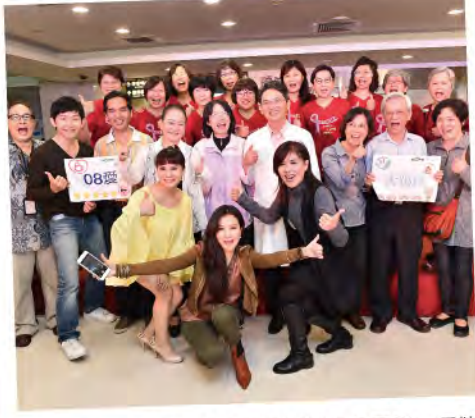
■ 歌手們、基隆長庚醫療團隊與病友團體一同攜手傳愛給更多病友希望的力量。