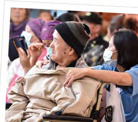
■ 癌友家庭專注聆聽癌症希望基金會「聽希望在這裡」關懷音樂會。