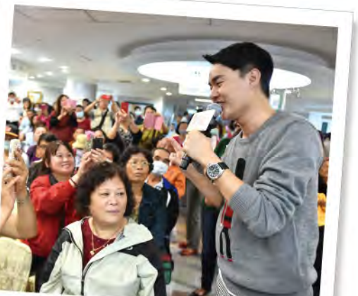
■ 許富凱用充滿穿透力的歌聲，要給病友最深刻的鼓舞。