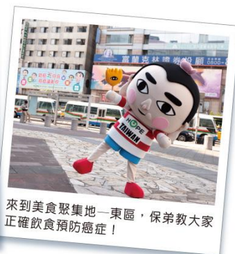
來到美食聚集地—東區，保弟教大家正確飲食預防癌症！