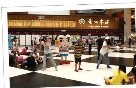
台北車站總是人潮滿滿，連阿伯都來一起跟保弟熱舞，提醒大家定期做篩檢，及早發現及早治療！

2016年，本會推出全新口號「防癌五保庇」，號召民眾共同施行五大防癌行動：正確飲食、規律運動、體重控制、拒菸酒檳、定期篩檢，要讓民眾身體力行一起防癌！並創作一吉祥物保弟，以戴上三太子頭套的小學生，象徵民眾防癌知識大多不足，但可以透過學習跟實踐精進提昇，維護自身健康預防癌症。今年暑假期間，更到捷運站快閃，保弟搭配生動的舞步與簡單明瞭的口號，更加貼近社會大眾，之後也會在校園、南投馬拉松跟大家見面，邀請大家一起防癌五保庇！