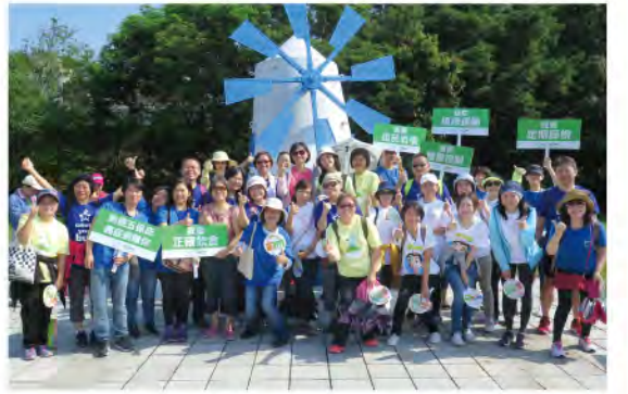
100位癌友及家屬手持「正確飲食」、「規律運動」、「體重控制」、「戒菸酒檳榔」及「定期篩檢」等防癌標語，呼籲大家防癌5保庇