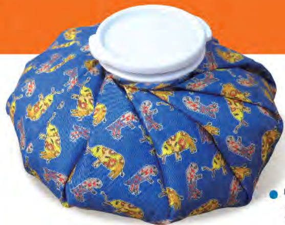
●「癌友打氣包」冷熱敷袋

更多活動詳情可至「希望在這裡」活動網址 www.ecancer.org.tw/2016hopeishere 或來電 (02)3322-6287分機126洽詢