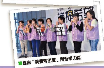
■感謝「美豐陶笛隊」用音樂力挺