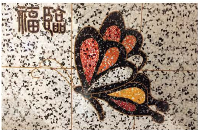
好愛這塊磨石：人生就是在不斷地打磨拋光後才得享福臨。