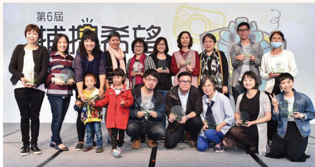
■第6屆「捕捉希望」得獎者、評審開心合影！

打開癌症的禮物盒，裡面究竟是什麼模樣？是身心煎熬的痛楚？是揮手道別的思念？是征服自己的期許？還是為愛前行的勇敢？