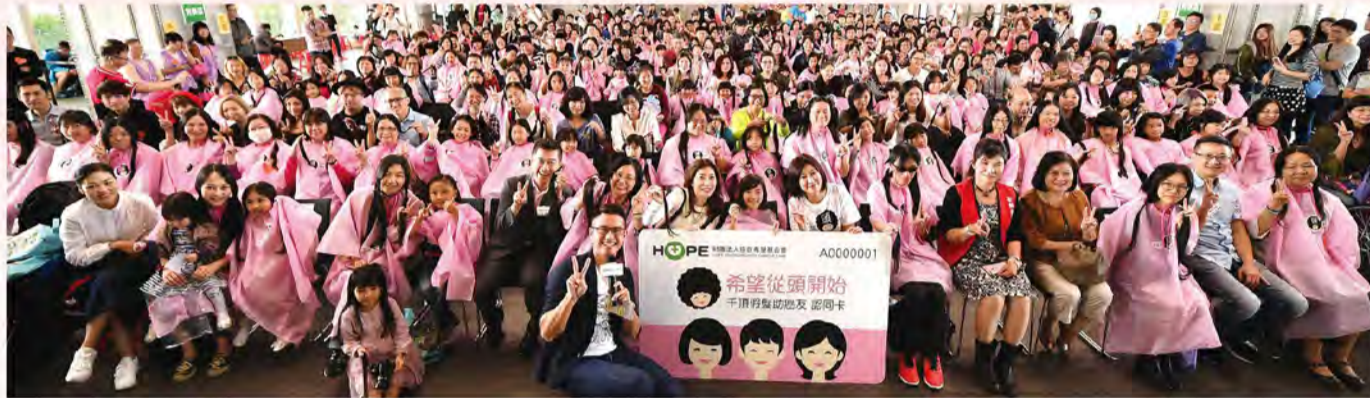
■全民集氣支持，成就頭髮的力量。(圖為2017年10月百人捐髮)