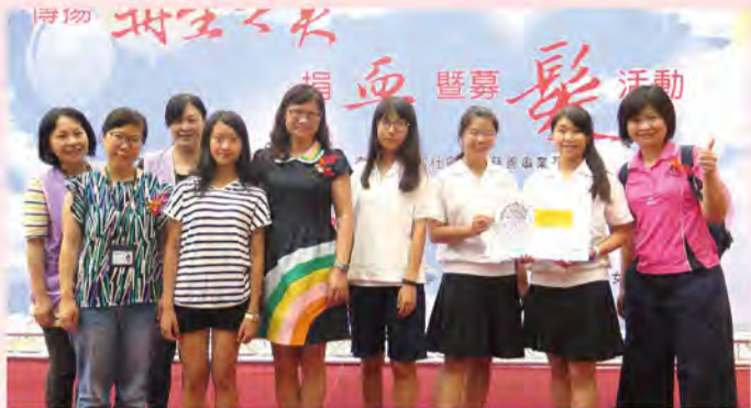
■走出戶外，為癌友需求發聲。(圖為2017年7月傳揚再生之美捐血暨募髮活動)