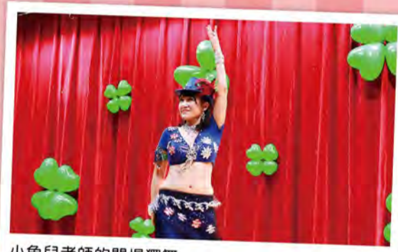
小魚兒老師的開場獨舞