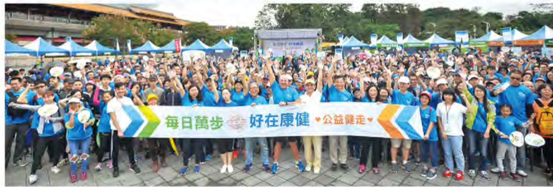
■為願全民健康，號召近2000人齊聚圓山花博公益健走。