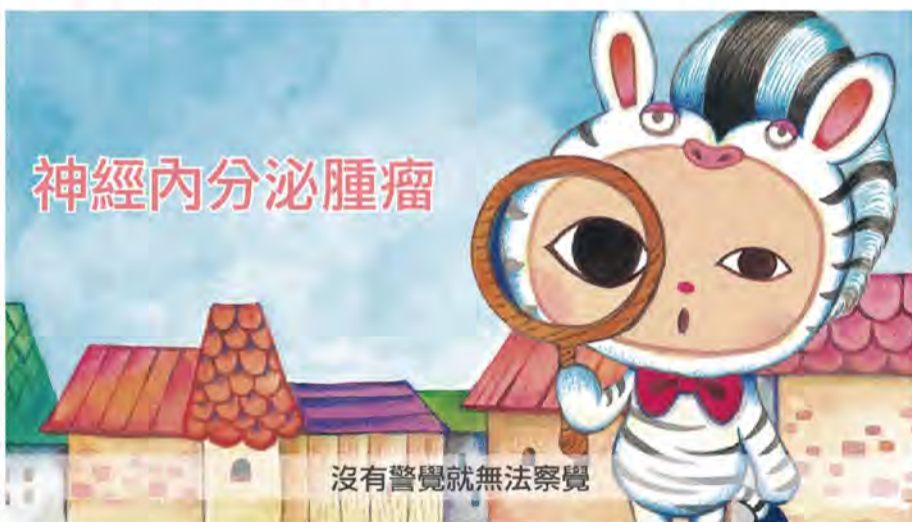
■藝術家眼球先生特別為神經內分泌腫瘤繪製全新十大症狀斑馬視覺圖樣