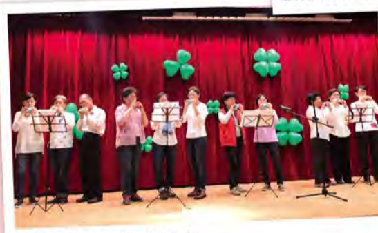
用陶笛輕鬆吹出天籟之音