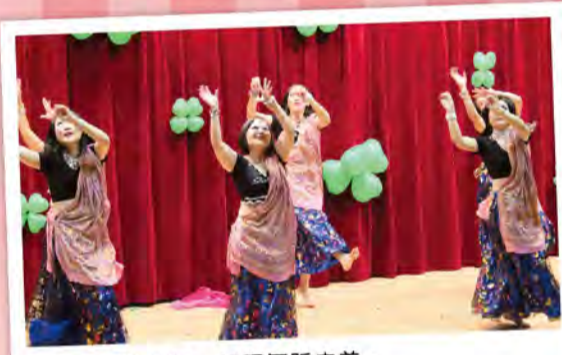
婀娜多姿肚皮舞，展現舞蹈之美。