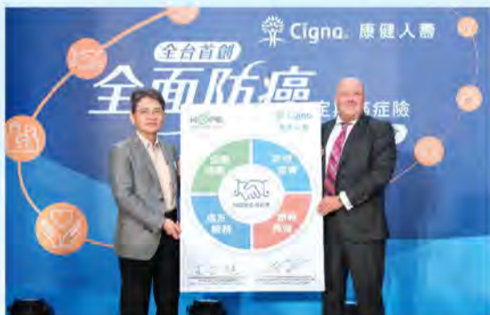
■為全面防癌，不僅首創台灣第一張針對癌症復發、轉移提供多重定額給付的創新保險商品，更承諾四年支持基金會推展各項癌友關懷服務。