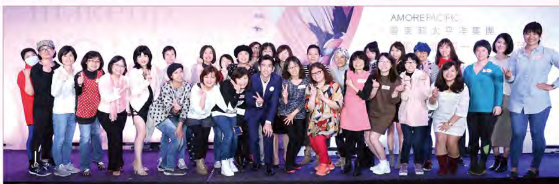
■修杰楷現身祝福癌友重拾自信、早日康復。

美麗，是什麼模樣？是在癌症威脅下，不輕言放棄的信念？是積極面對治療的勇敢？還是即使身處困境，也要努力讓自己過得一天比一天好的態度？