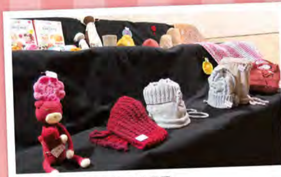
編織班獨一無二的帽子成果展