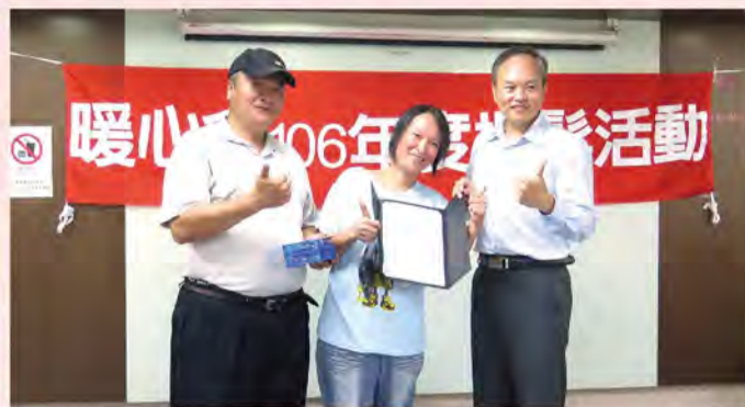
■民間社團接力響應，捐髮捐款助癌友。(圖為2017年8月台灣大車隊暖心會捐髮支持)