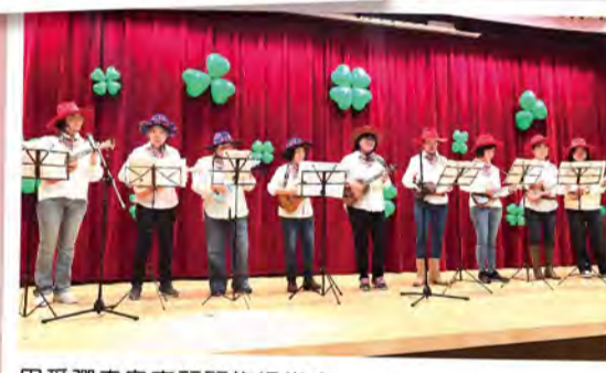
用愛彈奏烏克蘭悠揚樂章