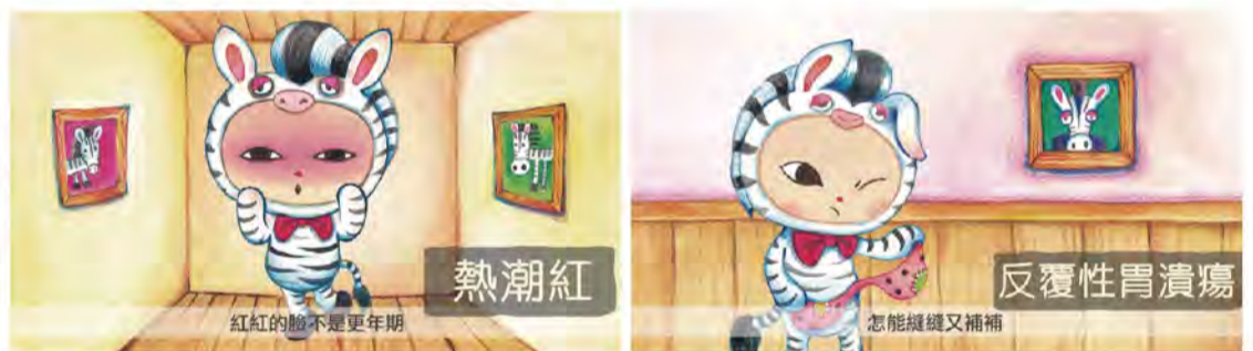
■神經內分泌腫瘤十大病症以手繪動畫方式呈現，並搭配眼球先生繪製的十大症狀斑馬以讓大家可以多關注此疾病。

每年11月10號為「世界神經內分泌腫瘤日 (World NET Awareness Day)」，國際上又以斑馬來暗喻此疾病，此疾病有許多症狀容易誤判，以至於當發現確診時通常都蠻嚴重的，因此，癌症希望基金會與藝術家眼球先生攜手合作，繪製全新症狀斑馬，並將十大症狀以動畫的方式呈現，再透過網路社群平台宣導，喚起大家對於此疾病的注意及關注。