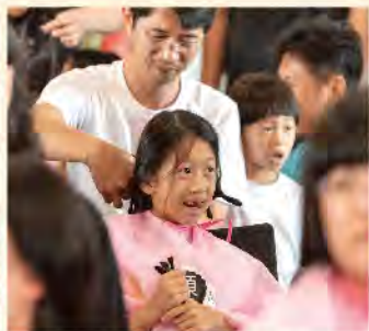
8歲女童剪下近70公分長髮助人。