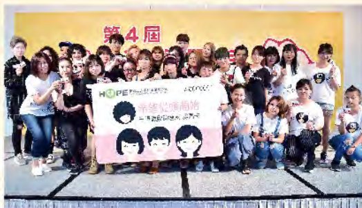
75位設計師助癌友的一期一會。