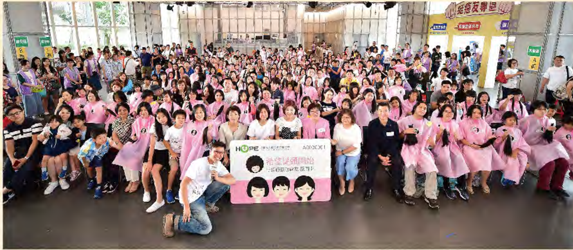
500人用行動籲癌友積極治療莫放棄。