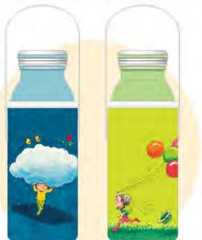
《我們》隨身瓶 這世界很美好 因為有我 《一起》隨身瓶 只要在一起 就是彼此的勇氣

一旦罹癌，面對短則半年，長則二至三年的治療期，除了身體的不適，工作被迫中斷，對經濟弱勢的癌友來說更是煎熬。故為讓治療階段生計陷入困境的癌友能在「急難救助金」的協助下，緩解家庭經濟急迫需求，癌症希望基金會「急難救助金」服務需要您捐款支持，即日起凡響應「2018希望在這裡」並單筆捐款滿1,500元，還可獲得乙個幾米向前走隨身瓶，捐款2,200元更可把乙組(兩個)帶回家，數量有限，送完為止，電洽(02)3322-6287分機128李小姐。