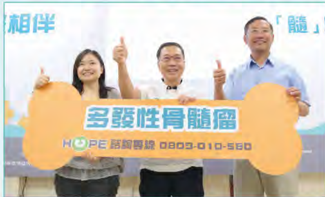
■本會與台大醫院血液腫瘤科共同進行「多發性骨髓瘤癌友及家屬癌後生活需求」研究

台灣高齡人口逐年增加，多發性骨髓瘤病友卻常因症狀與慢性病相似易延誤治療。有鑑於此，本會於6月26日舉行「多發性骨髓瘤記者會」，發表「多發性骨髓瘤癌友及家屬癌後生活需求」。台大醫院血液腫瘤科黃聖懿醫師表示，多發性骨髓瘤好發於65~70歲的男性，被稱為「老男人的癌症」，如果長期反覆出現骨痛、貧血、小便泡泡多、便秘等四大症狀，就需警覺主動就醫。