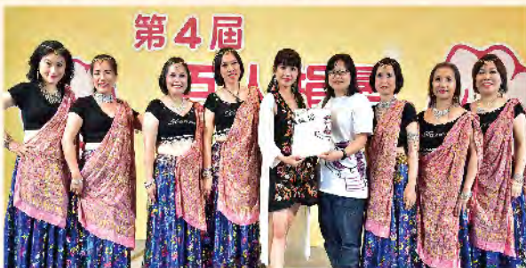
站上舞台，小魚兒（圖左5）現身與7位癌友說感謝。